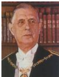
Charles De Gaulle Mai 1959 - Avril 1969