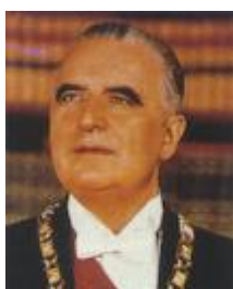
Georges Pompidou Juin 1969 - Avril 1974