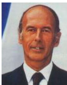
Valéry Giscard d'Estaing Mai 1974 - Mai 1981